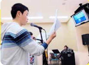
「アニメ声優にチャレンジ!」