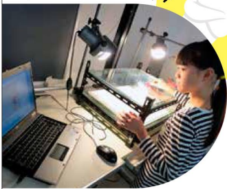
「オリジナルキャラクターでクリエイティブアニメを作ろう!」

「こども 夢・創造プロジェクト」は、さまざまな分野の「プロフェッショナル」を講師にむかえ、小・中学生のあこがれの分野や技術、作品づくりなどを本格的に体験できるプログラムです。プロフェッショナルの世界を実際に体験する貴重なチャンス! 「おもしろそう!」「やりたい!」その気持ちがあればOK! 自分の新たな才能に気付くかも!? どんどん参加してみよう!!