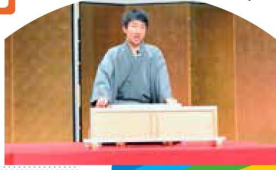
「上方落語の世界を体験しよう!」