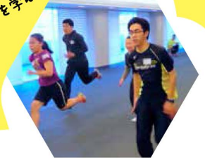
「スポーツアカデミー」

「こども 夢・創造プロジェクト」は大阪市と民間企業・団体の協働により実施しています。